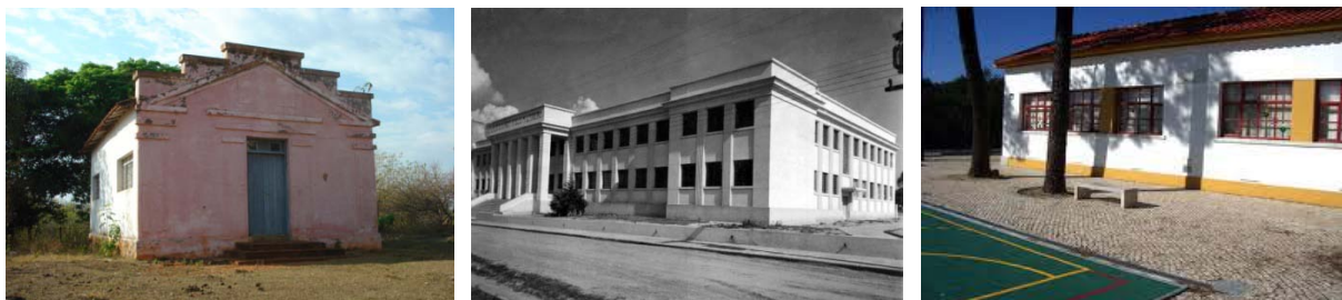
Figura 1- A Organização da Escola em Três Momentos 4 - escola de improviso (séc. XVIII a XIX), escolas-monumentos (final do séc. XIX) e escolas funcionais (1930 em diante).

proporcionando expansões dos sistemas de ensino, principalmente a partir de 1945 graças a uma conjuntura mais favorável ao ensino elementar, com a aprovação em 1946 da Lei Orgânica do Ensino Primário.